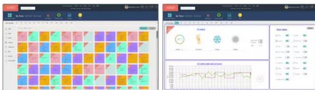
客房管理系统界面图

IRS 的模块设计均可从房间网关直接下载程序,让工程师远距离升级和使用房间系统,给初始安装和日后维修带来便利。其次,客房控制系统可提供来宾极致、奢华、便捷及舒适的住宿体验,不仅随时可用,且操作便捷,并可轻松的创建客户想要的场景模式。对于酒店业主